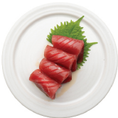
아카미 찢개 (속살) 16,000