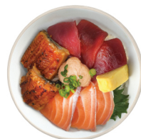
민물장어 명란 사케동 25,000 민물장어, 참치 속살, 생연어, 명란