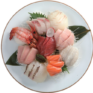
모듬 사시미 小 59,000 中 79,000 大 99,000 생참치, 광어, 방어 등 제철 해산물을 사용한 모듬 사시미