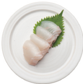
광어 사시미 12,000