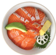
사케동 18,000 생연어, 아보카도