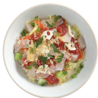
지라시시 17,000 와사비 간장과 곁들여 먹는 일본식 회덮밥