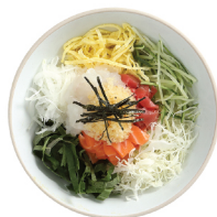
한국식 회덮밥 17,000 초고추장을 곁들인 한국식 회덮밥