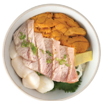
우니 도로 호다테동 39,000 성게소, 참치 뱃살, 관자