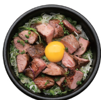
수비드 스테이크 덮밥 25,000 수비드 방식으로 조리한 살치살을 올린 덮밥