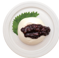
단팥 모찌리도후 10,000 달콤한 단팥소스를 올린 모찌리도후