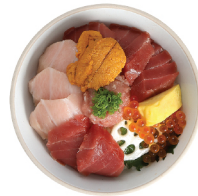
혼마구로 우니동 39,000 참치 속살, 참치 뱃살, 성게소, 연어알