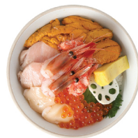
특선 우니동 39,000 성게소, 연어알, 관자, 참치 뱃살, 단새우