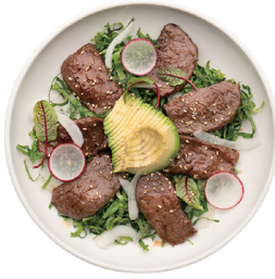
수비드 스테이크 샐러드 29,000 살치살을 수비드 방식으로 조리한 샐러드 요리