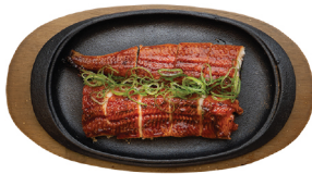
철판 민물장어구이 35,000