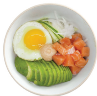
생연어 명란 아보카도덮밥 17,000 명란마요소스를 곁들인 고소한 생연어 아보카도덮밥