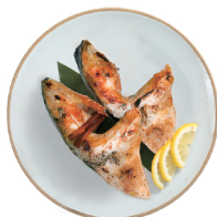
생연어 가마구이 17,000