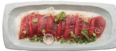
참마 프케 사시미 39,000 특제 간장 소스로 절여, 참마를 곁들인 생참치 아카미(숙살) 사시미