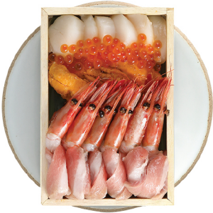
우니 도로 이쿠라 관자 에비 59,000 성게소, 참치 뱃살, 연어알, 가리비 관자, 단새우