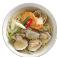
백합우동 13,000 백합으로 맛을 낸 일품 우동