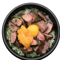
우니 수비드 스테이크 덮밥 33,000 수비드 방식으로 조리한 살치살과 우니를 올린 덮밥