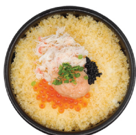
오복 게살 알밥 17,000 명란, 연어알, 게살, 날치알2종