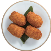
게살크림 고로케 2P 4,000 4P 8,000