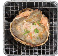
카니미소 구이 9,000