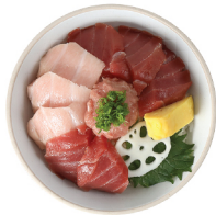
혼마구로동 27,000 참치 속살, 참치 뱃살