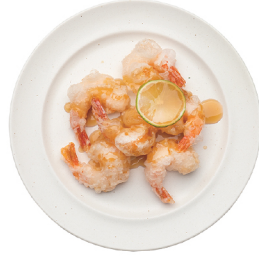
통새우 탕수 20,000 큼직한 통새우를 이용한 튀김 요리