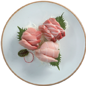
생참치 뱃살 사시미 59,000 생참치의 뱃살 만을 사용한 모듬 사시미