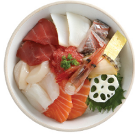
카이센동 22,000 광어, 생연어, 참치 2종, 한치, 단새우, 전복, 날치알 등