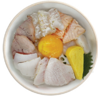
특선 아부리동 25,000 겉만 살짝 구워 풍미를 더한 카이센동