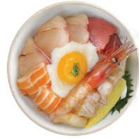
쓰께 카이센동 25,000 특제 간장소스에 살짝 절인 숙성회 및 해산물과 참마, 계란노른자