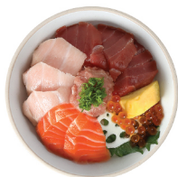
혼마구로 사케 이쿠라동 25,000 참치 속살, 참치 뱃살, 생연어, 연어알