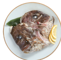
도미 머리구이 20,000