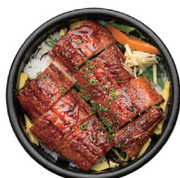
민물장어 덮밥 29,000 툇조림과 계란지단을 곁들인 민물장어 덮밥