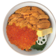
우니 이쿠라동 39,000 성게소, 연어알