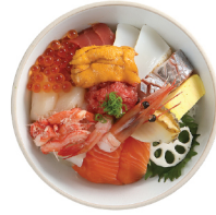
특선 카이센동 33,000 카이센동 + 성게소, 연어알, 게살