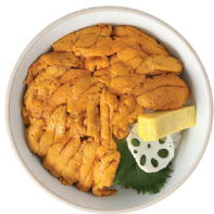
우니동 42,000 성게소