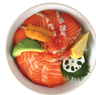
사케 우니 이쿠라동 28,000 생연어, 성게소, 연어알, 아보카도