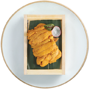
우니 반판 (40-50g) 25,000 우니 한판 (90-100g) 45,000