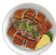
민물장어 네기도로덮밥 29,000 다진 참치를 곁들인 민물장어덮밥